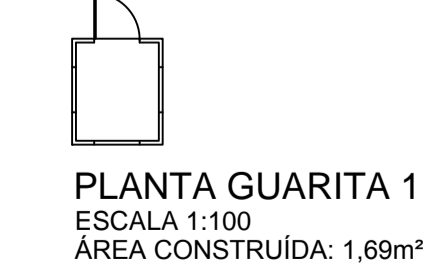
PLANTA GUARITA 1 ESCALA 1:100 ÁREA CONSTRUÍDA: 1,69m²