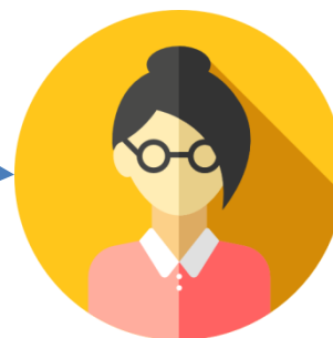
Responsável de Subprojeto