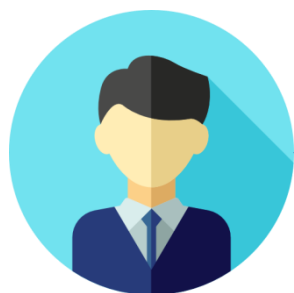
Coordenador de gestão estratégica