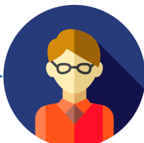
Gerente de Projeto