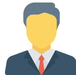
Secretários e Dirigentes máximos